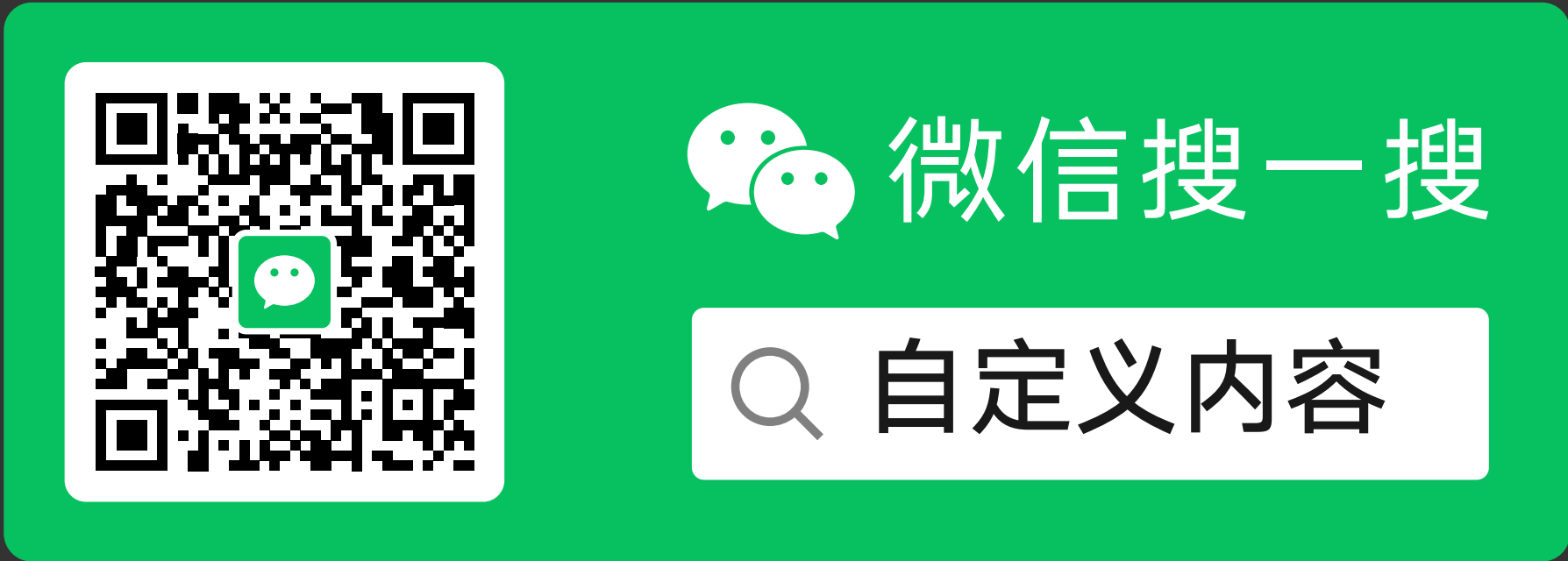
搜索框样式 A（带小程序码）