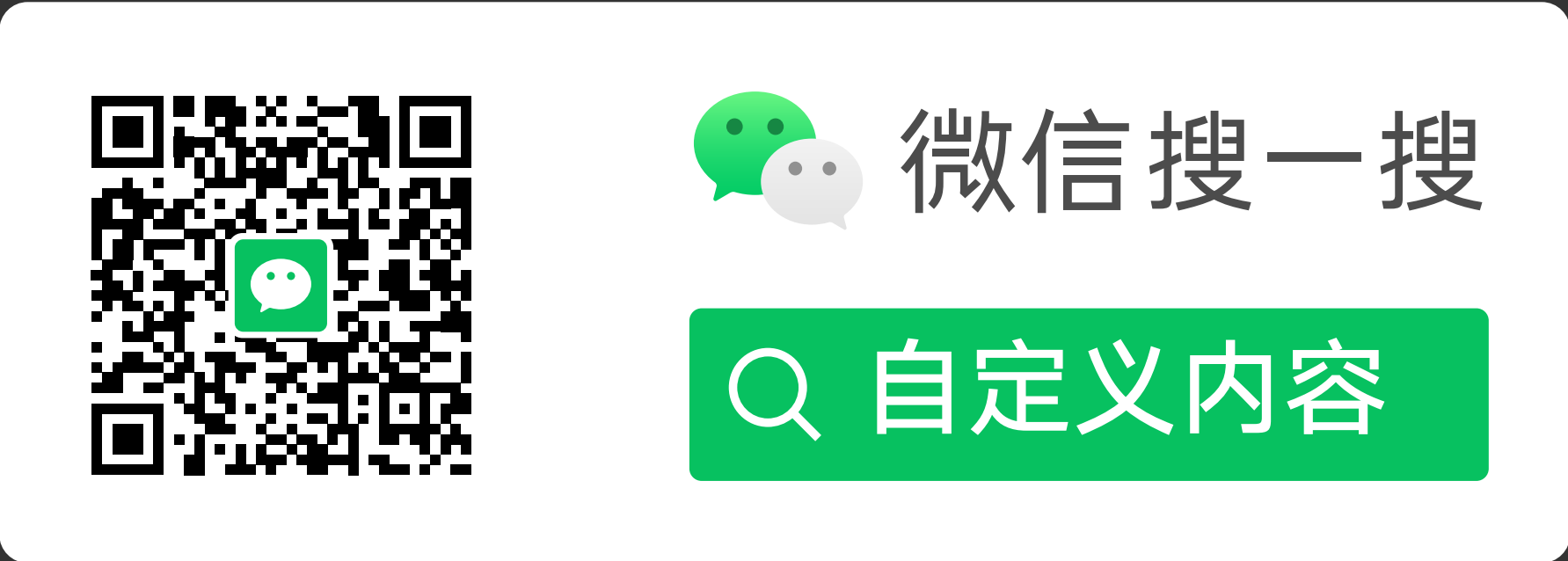
搜索框样式 A（带小程序码）