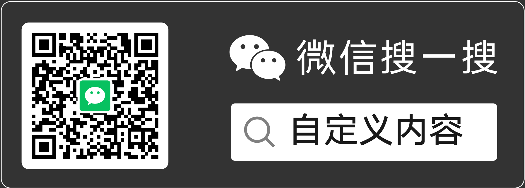
搜索框样式 A（带小程序码）