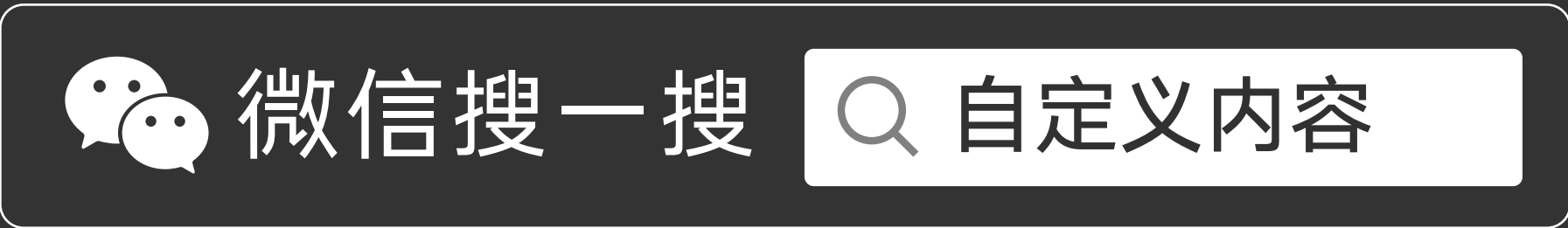
搜索框样式 C（带操作指引）