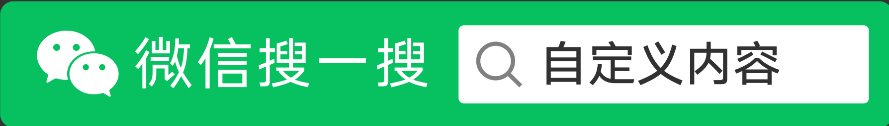
搜索框样式 C（带操作指引）